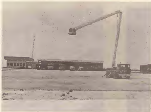
Mas equiponan nobo y moderno pa combati candela.

Teniendo paso cu e progreso di e comunidad Arubano, gobierno ta convirtiendo e cuerpo di bomberos den un verdadero cuerpo profesional. Mas personanan a worde tuma den servicio, mas equiponan moderno ta worde adquiri pa combati candela y duna asistencia den casonan di accidente y otro emergencianan.